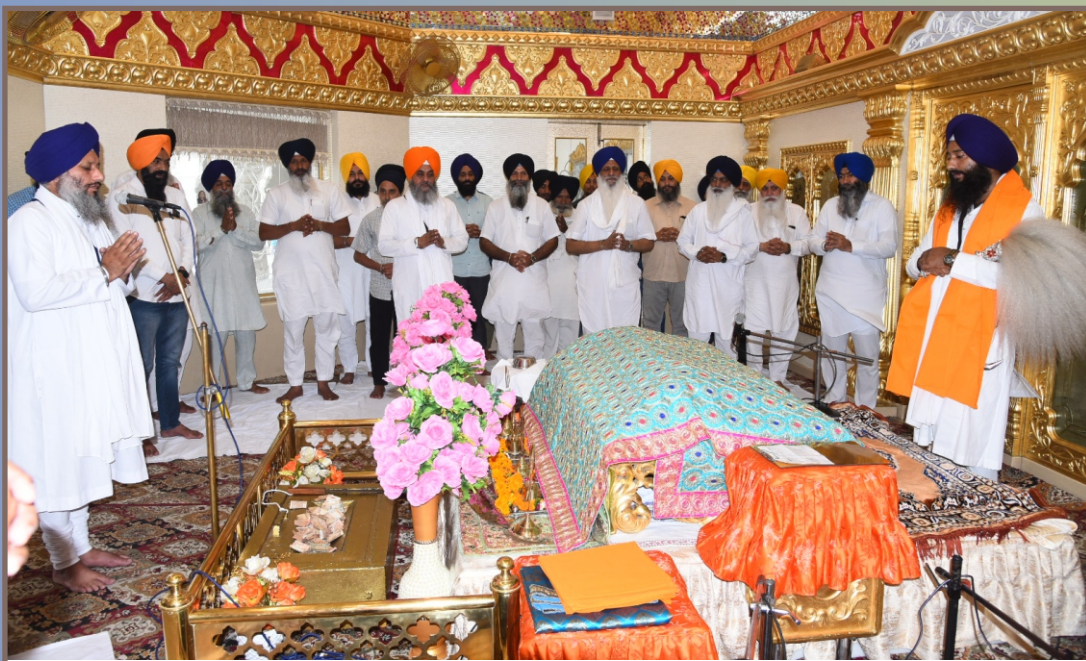
ਭਗਤ ਕਬੀਰ ਜੀ ਦੇ ਜਨਮ ਦਿਹਾੜੇ ਮੌਕੇ ਗੁਰਦੁਆਰਾ ਸ਼ਹੀਦ ਬਾਬਾ ਗੁਰਬਖਸ਼ ਸਿੰਘ ਜੀ ਵਿਖੇ ਸ੍ਰੀ ਅਖੰਡ ਪਾਠ ਸਾਹਿਬ ਜੀ ਦੇ ਭੋਗ ਉਪਰੰਤ ਅਰਦਾਸ 'ਚ ਸ਼ਾਮਲ ਸੰਗਤਾਂ। (24 ਜੂਨ)