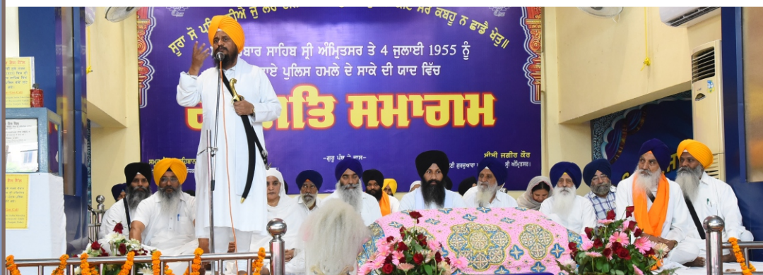
ਇਸ ਮੌਕੇ ਸੰਬੋਧਨ ਕਰਦੇ ਹੋਏ ਸ੍ਰੀ ਅਕਾਲ ਤਖਤ ਸਾਹਿਬ ਦੇ ਜਥੇਦਾਰ ਗਿਆਨੀ ਹਰਪ੍ਰੀਤ ਸਿੰਘ ਜੀ ਅਤੇ ਹਾਜ਼ਰ ਪ੍ਰਮੁੱਖ ਸ਼ਖਸੀਅਤਾਂ।