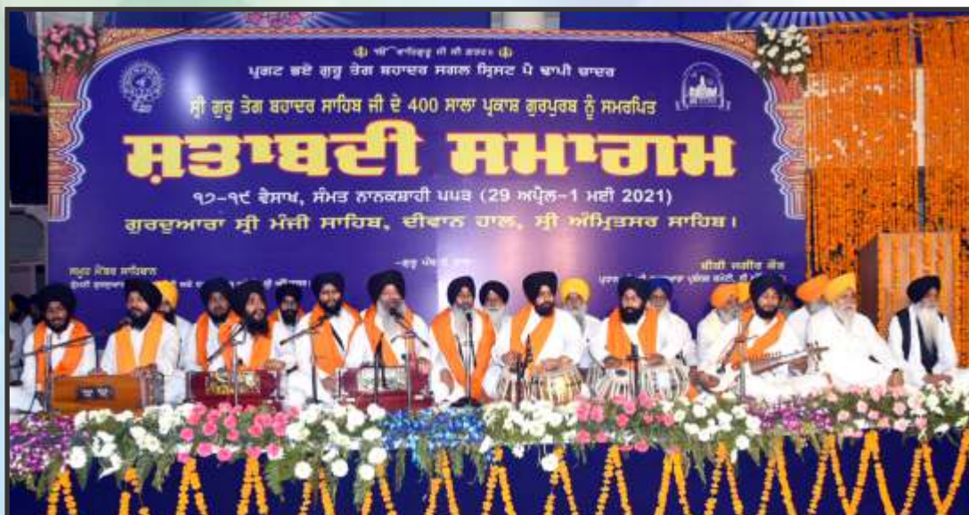
ਸ੍ਰੀ ਗੁਰੂ ਤੇਗ ਬਹਾਦਰ ਸਾਹਿਬ ਜੀ ਦੇ 400 ਸਾਲਾ ਪ੍ਰਕਾਸ਼ ਪੁਰਬ ਮੌਕੇ ਗੁਰਦੁਆਰਾ ਸ੍ਰੀ ਮੰਜੀ ਸਾਹਿਬ ਦੀਵਾਨ ਹਾਲ ਵਿਖੇ ਗੁਰਮਤਿ ਸਮਾਗਮ ਦੌਰਾਨ ਕੀਰਤਨ ਕਰਦੇ ਹੋਏ ਰਾਗੀ ਜਥੇ।