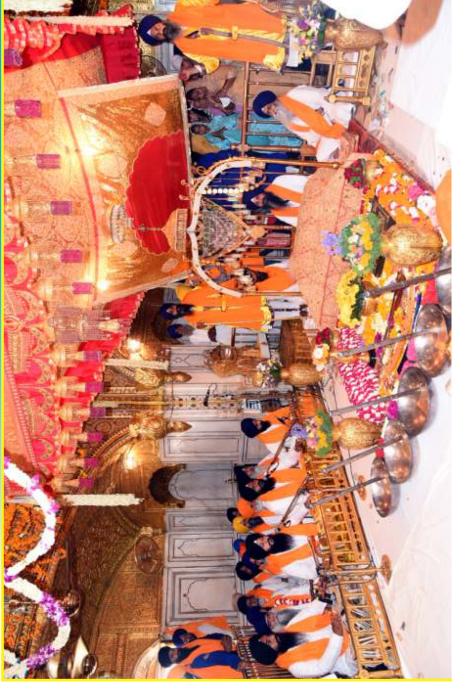
ਸ੍ਰੀ ਗੁਰੂ ਤੇਗ ਬਹਾਦਰ ਸਾਹਿਬ ਜੀ ਦੇ 400 ਸਾਲਾ ਪ੍ਰਕਾਸ਼ ਪੁਰਬ ਮੌਕੇ ਸੱਚਖੰਡ ਸ੍ਰੀ ਹਰਿਮੰਦਰ ਸਾਹਿਬ ਵਿਖੇ ਸਜਾਏ ਗਏ ਜਲੋਂ ਦਾ ਅਲੌਕਿਕ ਦ੍ਰਿਸ਼।