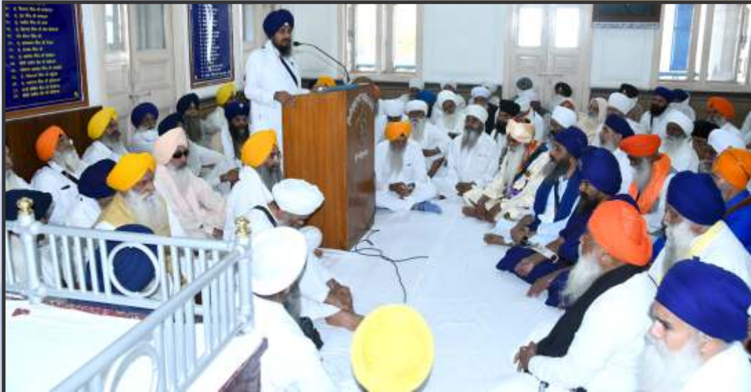
ਸ੍ਰੀ ਗੁਰੂ ਤੇਗ ਬਹਾਦਰ ਸਾਹਿਬ ਜੀ ਦੇ 400 ਸਾਲਾ ਪ੍ਰਕਾਸ਼ ਪੁਰਬ ਸਮਾਗਮਾਂ ਸਬੰਧੀ ਸਿੱਖ ਜਥੇਬੰਦੀਆਂ ਦੇ ਆਗੂਆਂ ਨਾਲ ਇਕੱਤਰਤਾ ਮੌਕੇ ਸੰਬੋਧਨ ਕਰਦੇ ਹੋਏ ਸ੍ਰੀ ਅਕਾਲ ਤਖ਼ਤ ਸਾਹਿਬ ਦੇ ਜਥੇਦਾਰ ਗਿਆਨੀ ਹਰਪ੍ਰੀਤ ਸਿੰਘ ਜੀ ਅਤੇ ਇਕੱਤਰਤਾ 'ਚ ਹਾਜ਼ਰ ਸੰਤ ਮਹਾਂਪੁਰਖ, ਨਿਹੰਗ ਸਿੰਘ ਜਥੇਬੰਦੀਆਂ, ਕਾਰ ਸੇਵਾ ਅਤੇ ਸਿੱਖ ਸੰਸਥਾਵਾਂ ਦੇ ਨੁਮਾਇੰਦੇ।