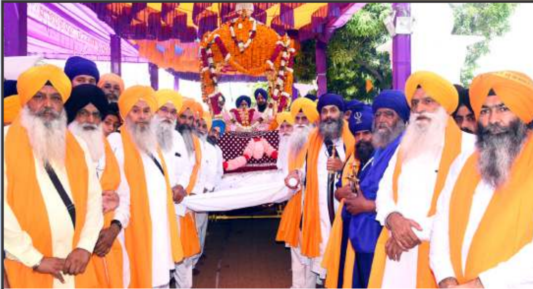
ਸ੍ਰੀ ਗੁਰੂ ਤੇਗ ਬਹਾਦਰ ਸਾਹਿਬ ਜੀ ਦੇ 400 ਸਾਲਾ ਪ੍ਰਕਾਸ਼ ਪੁਰਬ ਮੌਕੇ ਸ੍ਰੀ ਅਕਾਲ ਤਖ਼ਤ ਸਾਹਿਬ ਤੋਂ ਗੁਰਦੁਆਰਾ ਗੁਰੂ ਕੇ ਮਹਿਲ ਤੱਕ ਸਜਾਏ ਗਏ ਨਗਰ ਕੀਰਤਨ 'ਚ ਸ਼ਾਮਲ ਪ੍ਰਮੁੱਖ ਸ਼ਖ਼ਸੀਅਤਾਂ।