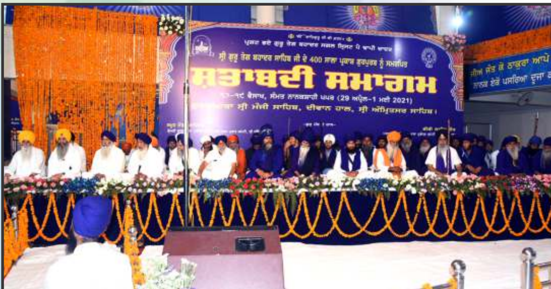
ਸ੍ਰੀ ਗੁਰੂ ਤੇਗ ਬਹਾਦਰ ਸਾਹਿਬ ਜੀ ਦੇ 400 ਸਾਲਾ ਪ੍ਰਕਾਸ਼ ਪੁਰਬ ਮੌਕੇ ਗੁਰਦੁਆਰਾ ਸ੍ਰੀ ਮੰਜੀ ਸਾਹਿਬ ਦੀਵਾਨ ਹਾਲ ਵਿਖੇ ਗੁਰਮਤਿ ਸਮਾਗਮ ਦੌਰਾਨ ਹਾਜ਼ਰ ਮੈਂਬਰ ਸਾਹਿਬਾਨ, ਪ੍ਰਮੁੱਖ ਸ਼ਖ਼ਸੀਅਤਾਂ ਅਤੇ ਨਿਰੰਗ ਜਥੇਬੰਦੀਆਂ ਦੇ ਨੁਮਾਇੰਦੇ।