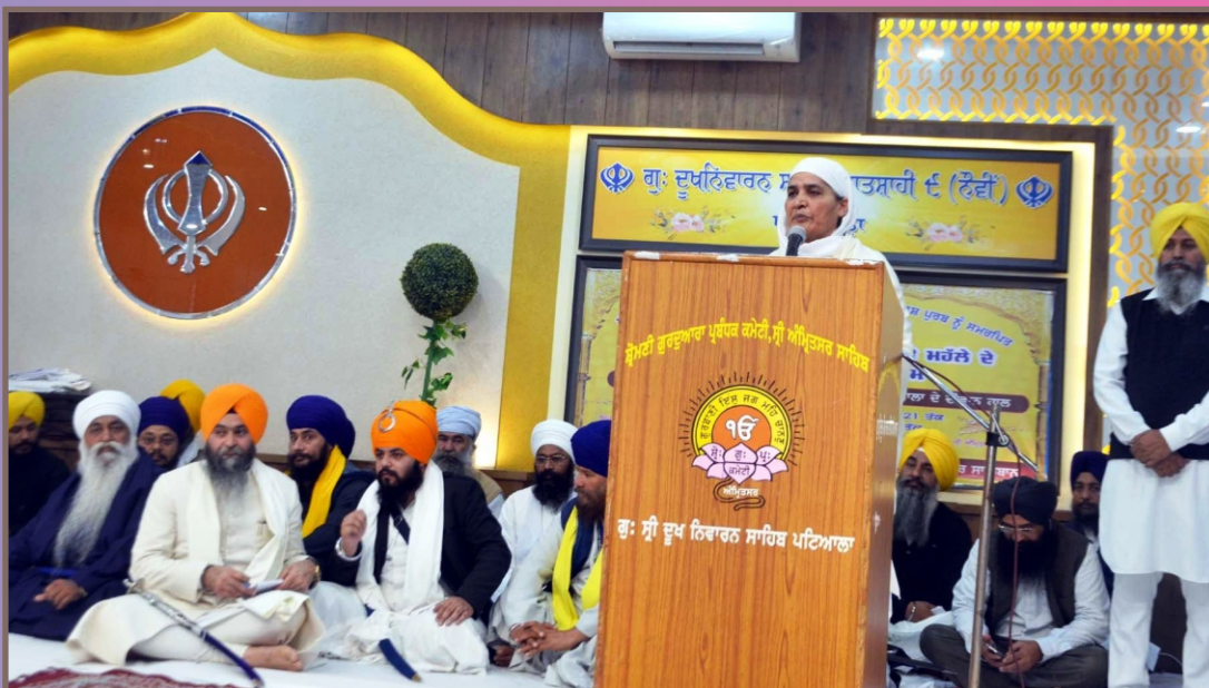
ਸ੍ਰੀ ਗੁਰੂ ਤੇਗ ਬਹਾਦਰ ਸਾਹਿਬ ਦੇ 400 ਸਾਲਾ ਪ੍ਰਕਾਸ਼ ਦਿਹਾੜੇ ਨੂੰ ਸਮਰਪਿਤ ਸ਼੍ਰੋਮਣੀ ਕਮੇਟੀ ਦੀ ਧਰਮ ਪ੍ਰਚਾਰ ਕਮੇਟੀ ਵੱਲੋਂ ਗੁਰਦੁਆਰਾ ਸ੍ਰੀ ਦੁਖਨਿਵਾਰਨ ਸਾਹਿਬ ਪਟਿਆਲਾ ਵਿਖੇ ਕਰਵਾਏ ਗਏ ਪਾਠ ਬੋਧ ਸਮਾਗਮ ਦੀ ਸੰਪੂਰਨਤਾ ਸਮੇਂ ਸੰਬੋਧਨ ਕਰਦੇ ਹੋਏ ਸ਼੍ਰੋਮਣੀ ਕਮੇਟੀ ਪ੍ਰਧਾਨ ਬੀਬੀ ਜਗੀਰ ਕੌਰ। (10 ਫਰਵਰੀ)