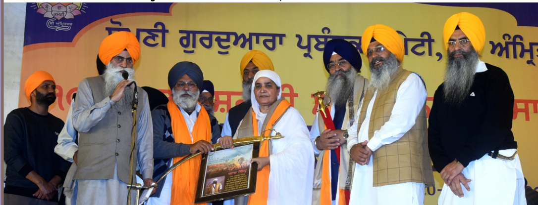
ਸਾਕਾ ਸ੍ਰੀ ਨਨਕਾਣਾ ਸਾਹਿਬ ਸਬੰਧੀ ਕਰਵਾਏ ਗਏ ਮੁੱਖ ਸਮਾਗਮ ਦੌਰਾਨ ਸ਼੍ਰੋਮਣੀ ਕਮੇਟੀ ਦੇ ਪ੍ਰਧਾਨ ਬੀਬੀ ਜਗੀਰ ਕੌਰ ਨੂੰ ਪਿੰਡ ਗੋਪਰਪੁਰ ਦੀਆਂ ਸੰਗਤਾਂ ਵੱਲੋਂ ਸਨਮਾਨਿਤ ਕੀਤੇ ਜਾਣ ਦੀ ਤਸਵੀਰ। (21 ਫਰਵਰੀ)