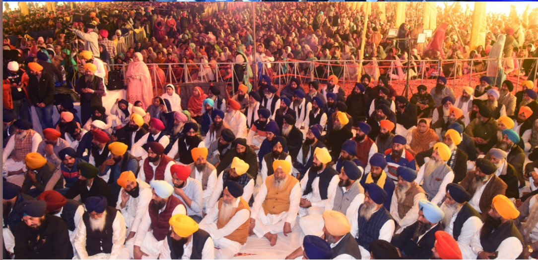
ਸਾਕਾ ਸ੍ਰੀ ਨਨਕਾਣਾ ਸਾਹਿਬ ਦੇ 100 ਸਾਲਾ ਸਬੰਧੀ ਕਰਵਾਏ ਗਏ ਮੁੱਖ ਸਮਾਗਮ ਦੌਰਾਨ ਪਹੁੰਚੀਆਂ ਸੰਗਤਾਂ। (21 ਫਰਵਰੀ)