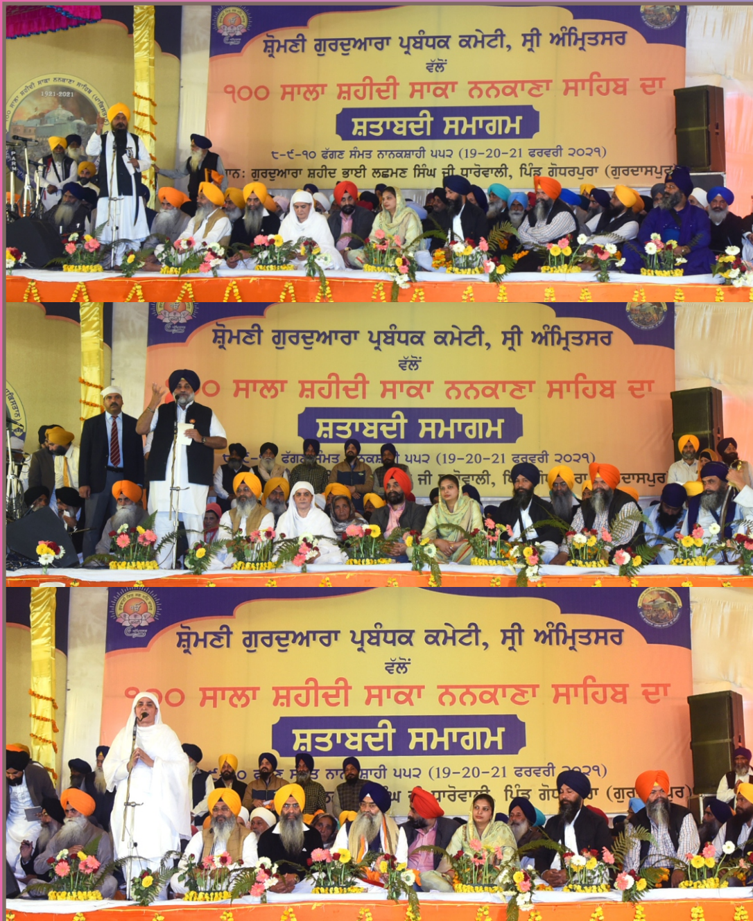
ਸਾਕਾ ਸ੍ਰੀ ਨਨਕਾਣਾ ਸਾਹਿਬ ਦੀ ਪਹਿਲੀ ਸ਼ਤਾਬਦੀ ਮੌਕੇ ਪਿੰਡ ਗੋਧਰਪੁਰ ਜ਼ਿਲ੍ਹਾ ਗੁਰਦਾਸਪੁਰ ਵਿਖੇ ਕਰਵਾਏ ਗਏ ਮੁੱਖ ਸਮਾਗਮ ਦੌਰਾਨ ਸੰਬੋਧਨ ਕਰਦੇ ਹੋਏ ਸ੍ਰੀ ਅਕਾਲ ਤਖਤ ਸਾਹਿਬ ਦੇ ਜਥੇਦਾਰ ਗਿਆਨੀ ਹਰਪ੍ਰੀਤ ਸਿੰਘ, ਸ਼੍ਰੋਮਣੀ ਅਕਾਲੀ ਦਲ ਦੇ ਪ੍ਰਧਾਨ ਸ. ਸੁਖਬੀਰ ਸਿੰਘ ਬਾਦਲ, ਸ਼੍ਰੋਮਣੀ ਗੁਰਦੁਆਰਾ ਪ੍ਰਬੰਧਕ ਕਮੇਟੀ ਦੇ ਪ੍ਰਧਾਨ ਬੀਬੀ ਜਗੀਰ ਕੌਰ ਅਤੇ ਸਟੇਜ 'ਤੇ ਹਾਜ਼ਰ ਪ੍ਰਮੁੱਖ ਸ਼ਖਸੀਅਤਾਂ। (21 ਫਰਵਰੀ)