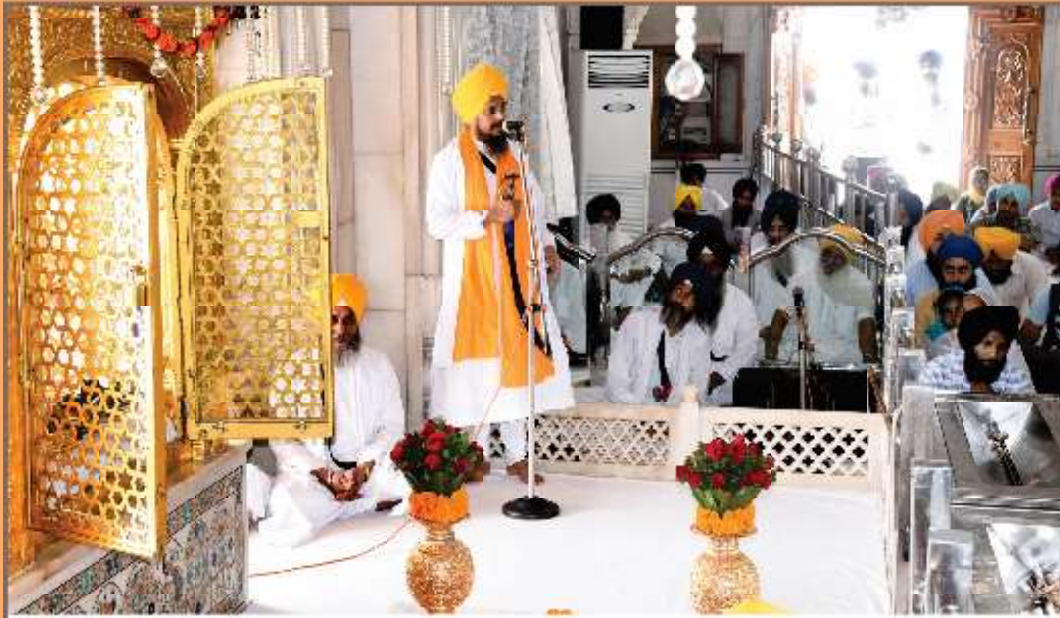
ਸ੍ਰੀ ਅਕਾਲ ਤਖਤ ਸਾਹਿਬ ਵਿਖੇ ਮੀਰੀ ਪੀਰੀ ਦਿਵਸ ਮੌਕੇ ਕਰਵਾਏ ਗਏ ਗੁਰਮਤਿ ਸਮਾਗਮ ਸਮੇਂ ਸੰਗਤ ਨੂੰ ਸੰਬੋਧਨ ਕਰਦੇ ਹੋਏ ਗਿਆਨੀ ਹਰਪ੍ਰੀਤ ਸਿੰਘ ਜਥੇਦਾਰ ਸ੍ਰੀ ਅਕਾਲ ਤਖਤ ਸਾਹਿਬ। (30 ਜੂਨ)