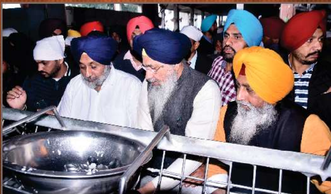
ਸ੍ਰੀ ਦਰਬਾਰ ਸਾਹਿਬ ਸ੍ਰੀ ਅੰਮ੍ਰਿਤਸਰ ਵਿਖੇ ਲੰਗਰ ਸ੍ਰੀ ਗੁਰੂ ਰਾਮਦਾਸ ਜੀ 'ਚ ਭਾਂਡੇ ਮੰਜਣ ਦੀ ਸੇਵਾ ਕਰਦੇ ਹੋਏ ਸ਼੍ਰੋਮਣੀ ਅਕਾਲੀ ਦਲ ਦੇ ਪ੍ਰਧਾਨ ਸ. ਸੁਖਬੀਰ ਸਿੰਘ ਬਾਦਲ, ਸ਼੍ਰੋਮਣੀ ਕਮੇਟੀ ਦੇ ਪ੍ਰਧਾਨ ਭਾਈ ਗੋਬਿੰਦ ਸਿੰਘ ਲੌਂਗੋਵਾਲ ਤੇ ਹੋਰ। (14 ਦਸੰਬਰ)