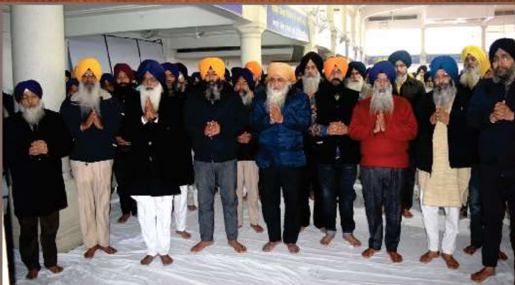
ਛੋਟੇ ਸਾਹਿਬਜ਼ਾਦੇ ਬਾਬਾ ਜ਼ੋਰਾਵਰ ਸਿੰਘ, ਬਾਬਾ ਫਤਹਿ ਸਿੰਘ ਅਤੇ ਮਾਤਾ ਕੁਜਰ ਕੌਰ ਜੀ ਦੀਆਂ ਲਾਸ਼ਨੀ ਸ਼ਹਾਦਤਾਂ ਨੂੰ ਸਮਰਪਿਤ ਗੁਰਦੁਆਰਾ ਮੰਜੀ ਸਾਹਿਬ ਦੀਵਾਨ ਹਾਲ, ਸ੍ਰੀ ਅੰਮ੍ਰਿਤਸਰ ਵਿਖੇ ਕਰਵਾਏ ਗਏ ਸ੍ਰੀ ਅਖੰਡਪਾਠ ਸਾਹਿਬ ਉਪਰੰਤ ਅਰਦਾਸ 'ਚ ਸ਼ਾਮਲ ਸ਼੍ਰੋਮਣੀ ਕਮੇਟੀ ਦੇ ਅਧਿਕਾਰੀ ਅਤੇ ਮੰਗਤਾਂ। (28 ਦਸੰਬਰ)