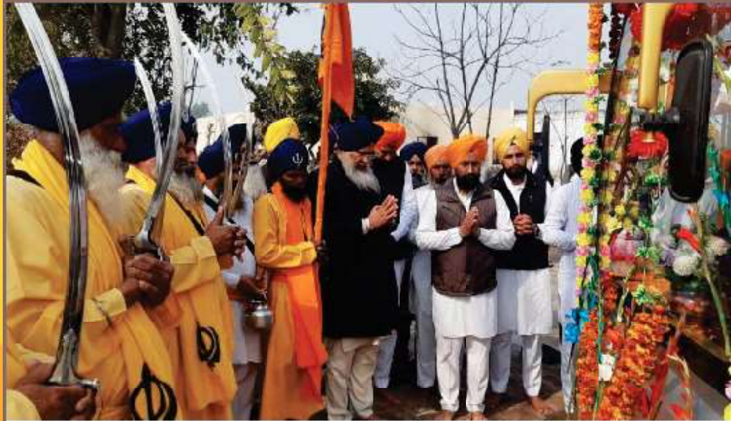
ਸ਼ਹੀਦ ਭਾਈ ਮਨੀ ਸਿੰਘ ਜੀ ਦੀ ਯਾਦ ਵਿਚ ਸਾਲਾਨਾ ਸਮਾਗਮ ਮੌਕੇ ਗੁਰਦੁਆਰਾ ਕੈਂਬੋਵਾਲ ਸਾਹਿਬ, ਲੌਂਗੋਵਾਲ ਤੋਂ ਸਜਾਏ ਗਏ ਨਗਰ ਕੀਰਤਨ ਦੀ ਆਰੰਭਤਾ ਸਮੇਂ ਅਰਦਾਸ ਵਿਚ ਸ਼ਾਮਲ ਪੰਜ ਪਿਆਰੇ ਸਾਹਿਬਾਨ, ਸ਼੍ਰੋਮਣੀ ਕਮੇਟੀ ਦੇ ਪ੍ਰਧਾਨ ਭਾਈ ਗੋਬਿੰਦ ਸਿੰਘ ਲੌਂਗੋਵਾਲ ਤੇ ਹੋਰ। (4 ਫਰਵਰੀ)