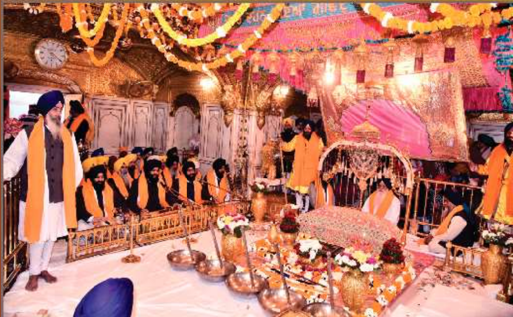
ਦਸਮ ਪਾਤਸ਼ਾਹ ਸ੍ਰੀ ਗੁਰੂ ਗੋਬਿੰਦ ਸਿੰਘ ਜੀ ਦੇ ਪ੍ਰਕਾਸ਼ ਪੁਰਬ ਮੌਕੇ ਸੰਚਖੰਡ ਸ੍ਰੀ ਹਰਿਮੰਦਰ ਸਾਹਿਬ ਵਿਖੇ ਸਜਾਏ ਗਏ ਜਲੋਂ ਦਾ ਮਨਮੋਹਕ ਦ੍ਰਿਸ਼। (2 ਜਨਵਰੀ)