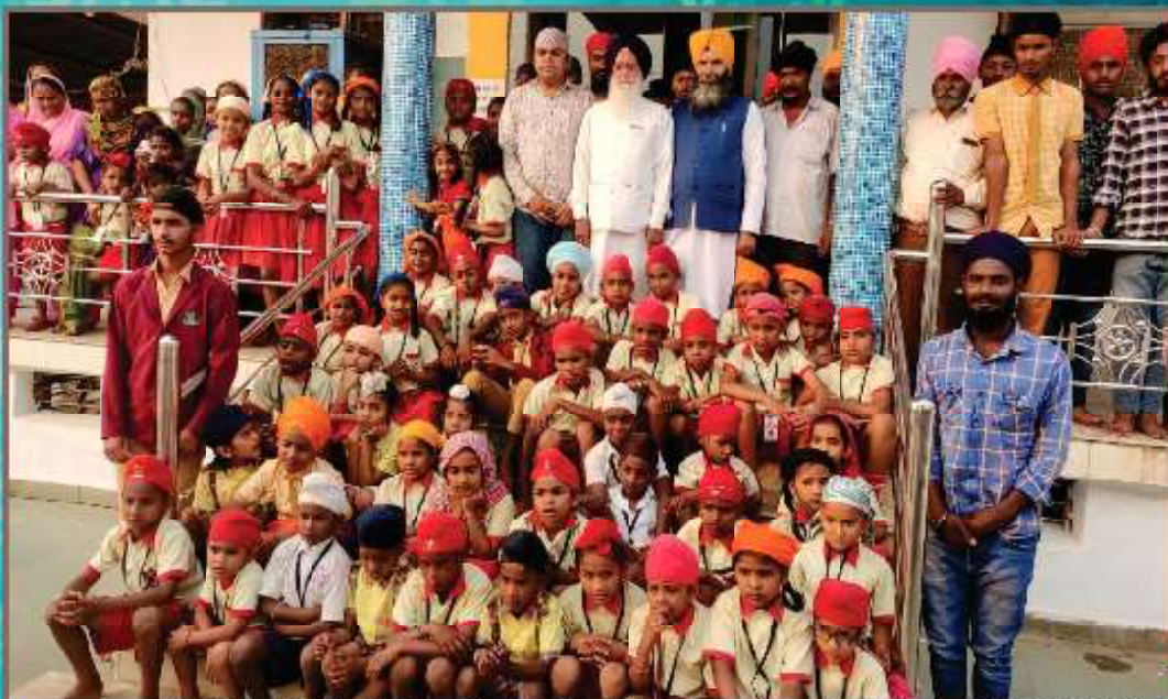
ਧਰਮ ਪ੍ਰਚਾਰ ਕਮੇਟੀ (ਸ਼੍ਰੋਮਣੀ ਕਮੇਟੀ) ਵੱਲੋਂ ਫੱਤੀਸਗੜ੍ਹ ਦੇ ਸਿਕਲੀਗਰ ਸਿੱਖ ਬੱਚਿਆਂ ਦੀਆਂ 12 ਲੱਖ ਰੁਪਏ ਸਕੂਲ ਫੀਸਾਂ ਦੇਣ ਸਮੇਂ ਸ਼੍ਰੋਮਣੀ ਕਮੇਟੀ ਦੇ ਨੁਮਾਇੰਦੇ ਸਿਕਲੀਗਰ ਸਿੱਖ ਬੱਚਿਆਂ ਨਾਲ।