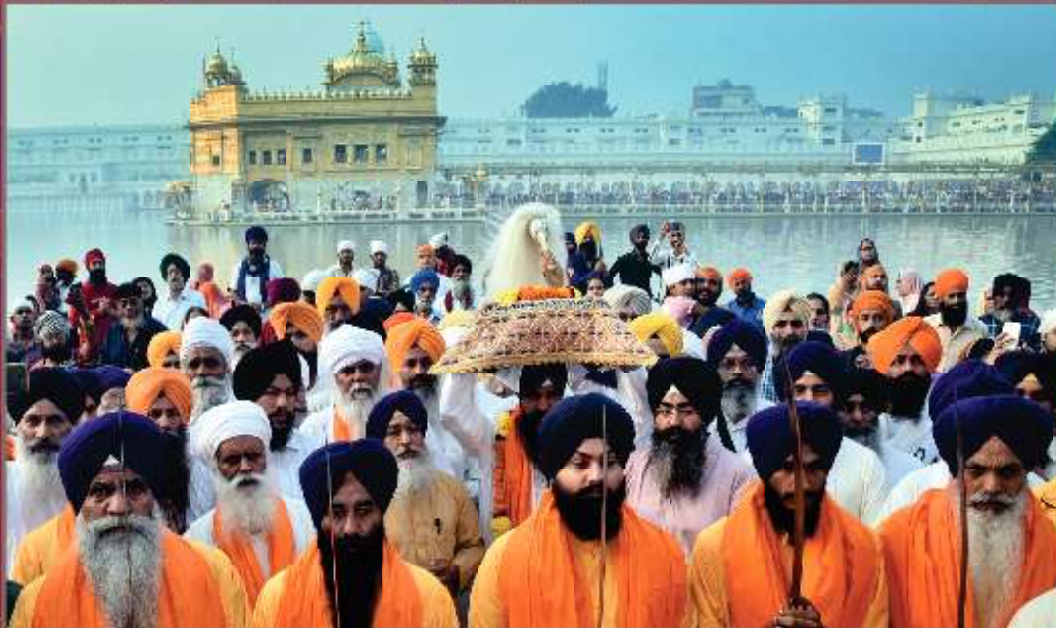
ਦਿੱਲੀ ਤੋਂ ਗੁਰਦੁਆਰਾ ਸ੍ਰੀ ਨਨਕਾਣਾ ਸਾਹਿਬ ਪਾਕਿਸਤਾਨ ਲਈ ਸਜਾਇਆ ਗਿਆ ਨਗਰ ਕੀਰਤਨ ਸੱਚਖੰਡ ਸ੍ਰੀ ਹਰਿਮੰਦਰ ਸਾਹਿਬ ਸ੍ਰੀ ਅੰਮ੍ਰਿਤਸਰ ਤੋਂ ਅੱਗੇ ਰਵਾਨਾ ਹੋਣ ਸਮੇਂ ਦਾ ਦ੍ਰਿਸ਼। (31 ਅਕਤੂਬਰ)