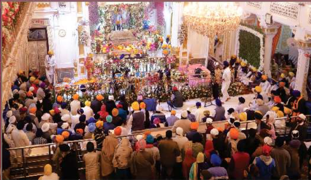
550ਵੇਂ ਪ੍ਰਕਾਸ਼ ਪੁਰਬ ਮੌਕੇ ਗੁਰਦੁਆਰਾ ਸ੍ਰੀ ਬੋਰ ਸਾਹਿਬ ਸੁਲਤਾਨਪੁਰ ਲੋਧੀ ਵਿਖੇ 12 ਤੇ 13 ਨਵੰਬਰ ਦੀ ਦਰਮਿਆਨੀ ਰਾਤ ਸ੍ਰੀ ਅਖੰਡਪਾਠ ਸਾਹਿਬ ਦੇ ਭੋਗ ਸਮੇਂ ਦਾ ਅਲੌਕਿਕ ਦ੍ਰਿਸ਼।