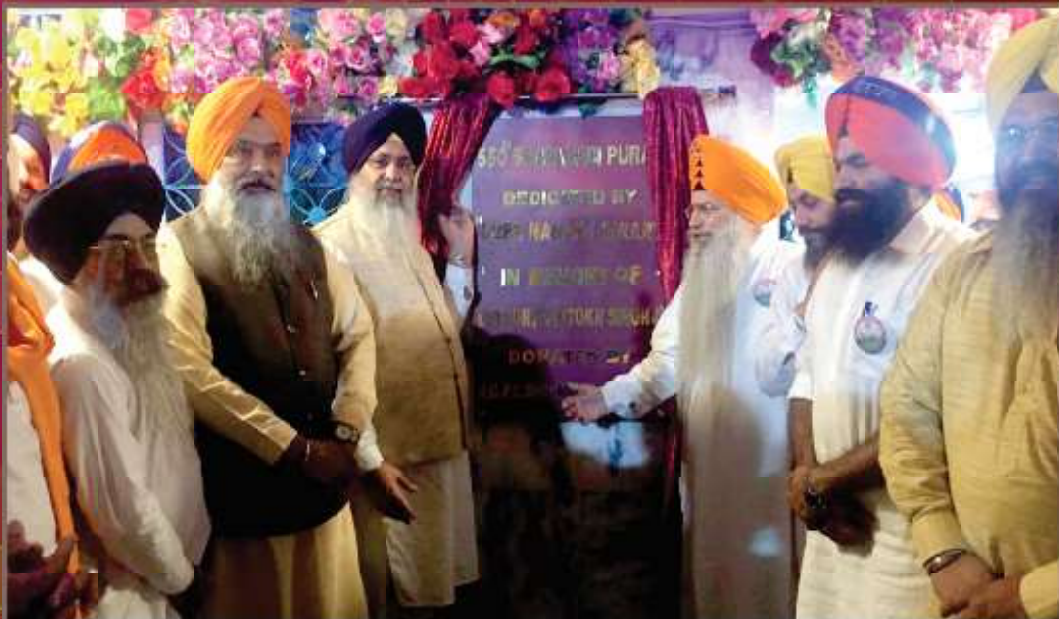
ਗੁਰਦੁਆਰਾ ਨਾਨਕਸਰ ਹਮੀਦੀਆ ਰੋਡ ਤੋਪਾਲ ਵਿਖੇ ਫੈਡਰੇਸ਼ਨ ਦੇ ਮੰਦੀ ਸਵਾਰਗੀ ਡਾ. ਸੰਤੋਖ ਸਿੰਘ ਯਾਦਗਾਰੀ ਲਾਇਬ੍ਰੇਰੀ ਦਾ ਉਦਘਾਟਨ ਕਰਦੇ ਹੋਏ ਭਾਈ ਗੋਬਿੰਦ ਸਿੰਘ ਲੌਂਗੋਵਾਲ, ਪ੍ਰੋ. ਪ੍ਰੇਮ ਸਿੰਘ ਚੰਦੂਮਾਜਰਾ ਅਤੇ ਹੋਰ। (12 ਅਕਤੂਬਰ)