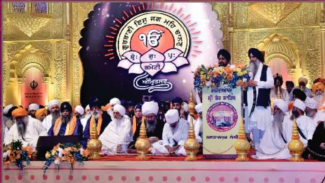
ਸ੍ਰੀ ਗੁਰੂ ਨਾਨਕ ਦੇਵ ਜੀ ਦੇ 550ਵੇਂ ਪ੍ਰਕਾਸ਼ ਪੁਰਬ ਮੌਕੇ ਗੁਰੂ ਨਾਨਕ ਸਟੇਡੀਅਮ ਸੁਲਤਾਨਪੁਰ ਲੋਧੀ ਵਿਖੇ ਮੁੱਖ ਸਮਾਗਮ ਦੌਰਾਨ ਕੌਮ ਦੇ ਨਾਮ ਸੰਦੇਸ਼ ਦਿੰਦੇ ਹੋਏ ਸ੍ਰੀ ਅਕਾਲ ਤਖ਼ਤ ਸਾਹਿਬ ਦੇ ਜਥੇਦਾਰ ਗਿਆਨੀ ਹਰਪ੍ਰੀਤ ਸਿੰਘ ਅਤੇ ਸਟੇਜ 'ਤੇ ਬਿਰਾਜਮਾਨ ਪ੍ਰਮੁੱਖ ਧਾਰਮਿਕ ਸ਼ਖ਼ਸੀਅਤਾਂ। (12 ਨਵੰਬਰ)