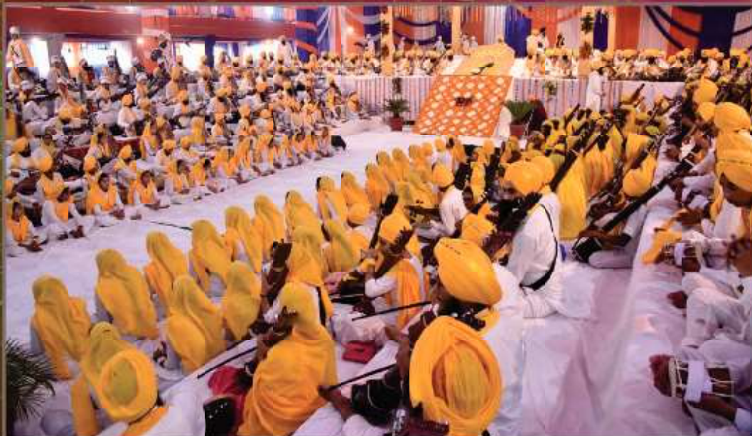
ਸ਼੍ਰੋਮਣੀ ਕਮੇਟੀ ਵੱਲੋਂ ਗੁਰਦੁਆਰਾ ਸ੍ਰੀ ਬੇਰ ਸਾਹਿਬ ਸੁਲਤਾਨਪੁਰ ਲੋਧੀ ਦੇ ਭਾਈ ਮਰਦਾਨਾ ਜੀ ਦੀਵਾਨ ਹਾਲ 'ਚ ਨਿਰਧਾਰਤ ਭੱਤੀ ਸਾਜ਼ਾਂ ਨਾਲ 550 ਰਬਾਬੀ ਕੀਰਤਨਕਾਰਾਂ ਵੱਲੋਂ ਗੁਰਬਾਣੀ ਕੀਰਤਨ ਕੀਤੇ ਜਾਣ ਦਾ ਅਲੌਕਿਕ ਦ੍ਰਿਸ਼। (1 ਨਵੰਬਰ)