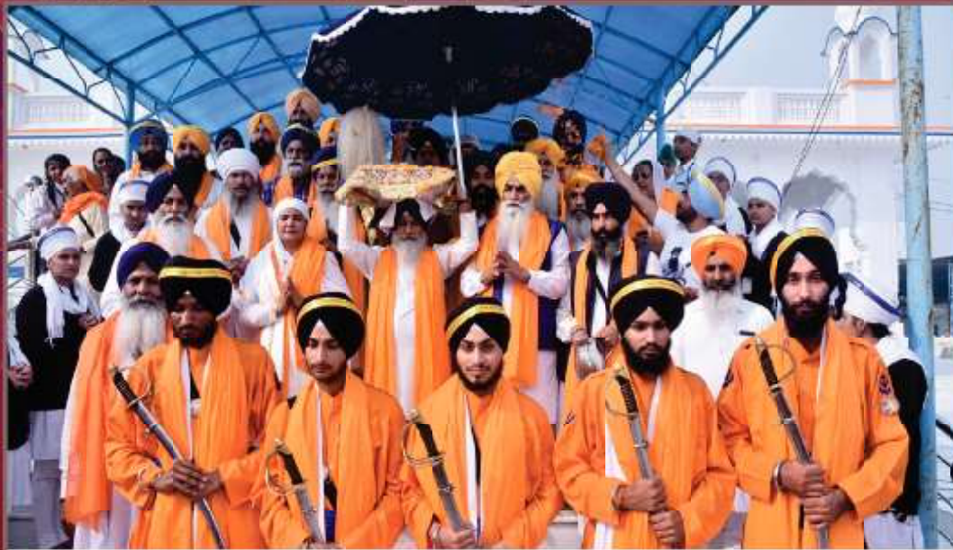
ਸ਼੍ਰੋਮਣੀ ਕਮੇਟੀ ਵੱਲੋਂ 550 ਸਾਲਾ ਪ੍ਰਕਾਸ਼ ਪੁਰਬ ਸਮਾਗਮਾਂ ਦੀ ਆਰੰਭਤਾ ਮੌਕੇ ਗੁਰਦੁਆਰਾ ਸ੍ਰੀ ਵਬਾਬਸਰ ਸਾਹਿਬ ਤੋਂ 550 ਰਬਾਬੀਆਂ ਦੀ ਸ਼ਮੂਲੀਅਤ ਸਹਿਤ ਸਜਾਏ ਨਗਰ ਕੀਰਤਨ ਦੀ ਆਰੰਭਤਾ ਸਮੇਂ ਦਾ ਦ੍ਰਿਸ਼। (1 ਨਵੰਬਰ)