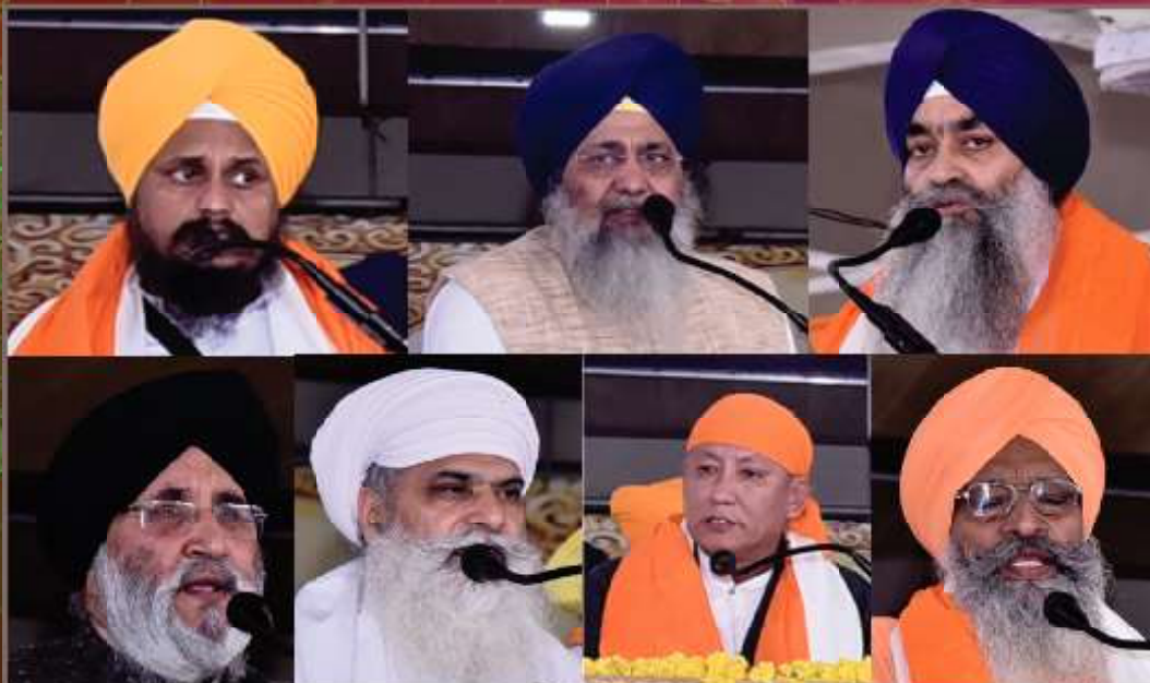
ਸ੍ਰੀ ਗੁਰੂ ਨਾਨਕ ਦੇਵ ਜੀ ਦੇ 550ਵੇਂ ਪ੍ਰਕਾਸ਼ ਪੁਰਬ ਨੂੰ ਸਮਰਪਿਤ ਸ਼੍ਰੋਮਣੀ ਗੁਰਦੁਆਰਾ ਪ੍ਰਬੰਧਕ ਕਮੇਟੀ ਵੱਲੋਂ ਤਖ਼ਤ ਸ੍ਰੀ ਕੇਸਗੜ੍ਹ ਸਾਹਿਬ ਦੇ ਦਸਮੇਸ਼ ਦੀਵਾਨ ਹਾਲ ਵਿਖੇ ਗੁਰੂ ਨਾਨਕ ਨਾਮ ਲੇਵਾ ਸਿੱਖ ਸੰਮੇਲਨ ਦੌਰਾਨ ਸੰਬੰਧਨ ਕਰਦੀਆਂ ਹੋਈਆਂ ਪ੍ਰਮੁੱਖ ਸ਼ਖਸੀਅਤਾਂ। (10 ਅਕਤੂਬਰ)