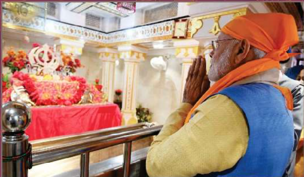
ਸ੍ਰੀ ਗੁਰੂ ਨਾਨਕ ਦੇਵ ਜੀ ਦੇ 550ਵੇਂ ਪ੍ਰਕਾਸ਼ ਪੁਰਬ ਮੌਕੇ ਗੁਰਦੁਆਰਾ ਸ੍ਰੀ ਬੋਰ ਸਾਹਿਬ ਸੁਲਤਾਨਪੁਰ ਲੋਧੀ ਵਿਖੇ ਨਤਮਸਤਕ ਹੋਣ ਸਮੇਂ ਭਾਰਤ ਦੇ ਪ੍ਰਧਾਨ ਮੰਤਰੀ ਸ੍ਰੀ ਨਰਿੰਦਰ ਮੋਦੀ ਸ੍ਰੀ ਡੋਰਾ ਸਾਹਿਬ ਦੇ ਦਰਸ਼ਨ ਕਰਦੇ ਹੋਏ। (9 ਨਵੰਬਰ)