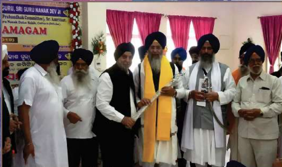
ਸ਼੍ਰੋਮਣੀ ਕਮੇਟੀ ਵੱਲੋਂ ਸ੍ਰੀ ਗੁਰੂ ਨਾਨਕ ਦੇਵ ਜੀ ਦੇ 550ਵੇਂ ਪ੍ਰਕਾਸ਼ ਪੁਰਬ ਨੂੰ ਸਮਰਪਿਤ ਗੁਰਦੁਆਰਾ ਦਾਤਣ ਸਾਹਿਬ ਕੱਟਕ ਵਿਖੇ ਗੁਰਮਤਿ ਸਮਾਜਮ ਦੌਰਾਨ ਸ਼੍ਰੋਮਣੀ ਕਮੇਟੀ ਪ੍ਰਧਾਨ ਭਾਈ ਗੋਬਿੰਦ ਸਿੰਘ ਲੌਂਗੋਵਾਲ ਨੂੰ ਸਨਮਾਨਿਤ ਕਰਦੇ ਹੋਏ ਸਬਾਨਰ ਸਿੱਖ ਆਗੂ। (20 ਜਨਵਰੀ)