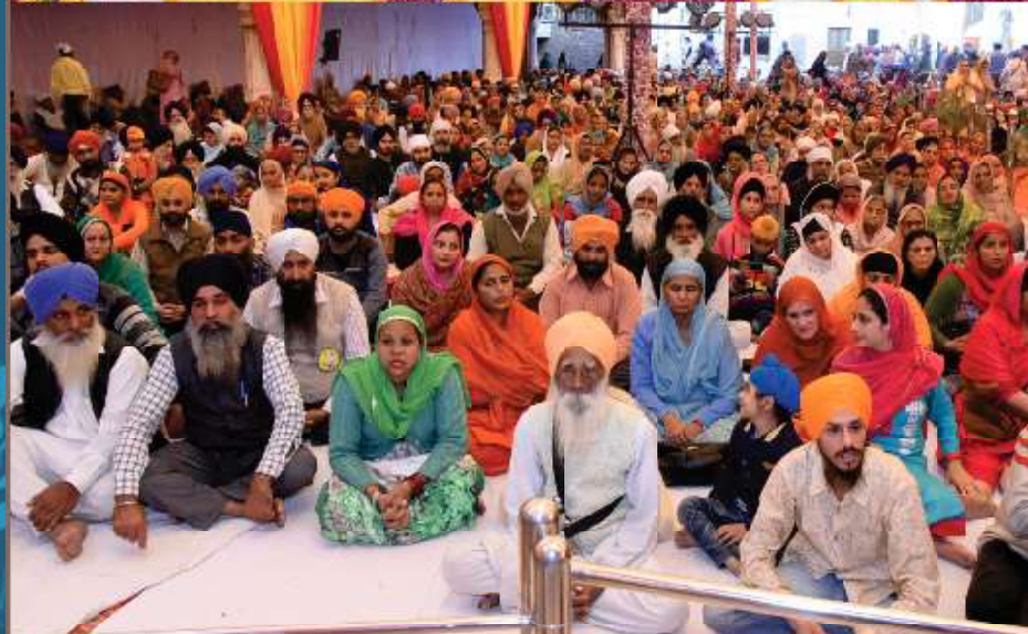
ਬਾਬਾ ਦੀਪ ਸਿੰਘ ਜੀ ਦੇ ਸ਼ਹੀਦੀ ਦਿਹਾੜੇ ਸਮੇਂ ਗੁਰਦੁਆਰਾ ਸ਼ਹੀਦ ਗੰਜ ਬਾਬਾ ਦੀਪ ਸਿੰਘ ਜੀ ਵਿਖੇ ਕਰਵਾਏ ਗਏ ਪਾਰਮਿਕ ਸਮਾਗਮ ਦੌਰਾਨ ਗੁਰਬਾਣੀ ਕੀਰਤਨ ਕਰਦਾ ਹੋਇਆ ਰਾਗੀ ਜਥਾ ਅਤੇ ਮਨੋਹਰ ਕੀਰਤਨ ਦਾ ਆਨੰਦ ਮਾਣਦੀਆਂ ਹੋਈਆਂ ਸੰਗਤਾਂ। (15 ਨਵੰਬਰ)