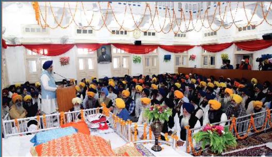
ਸ਼੍ਰੋਮਣੀ ਗੁਰਦੁਆਰਾ ਪ੍ਰਬੰਧਕ ਕਮੇਟੀ ਦੇ ਸਥਾਪਨਾ ਦਿਵਸ ਸਮਾਗਮ ਮੌਕੇ ਤੇਜਾ ਸਿੰਘ ਸਮੁੰਦਰੀ ਹਾਲ ਵਿਖੇ ਮੈਂਬਰ ਸਾਹਿਬਜ਼ਾਦ ਅਤੇ ਮੁਲਾਜ਼ਮਾਂ ਨੂੰ ਸੰਬੋਧਨ ਕਰਦੇ ਹੋਏ ਸ਼੍ਰੋਮਣੀ ਕਮੇਟੀ ਦੇ ਪ੍ਰਧਾਨ ਭਾਈ ਗੋਬਿੰਦ ਸਿੰਘ ਲੌਂਗੋਵਾਲ। (16 ਨਵੰਬਰ)