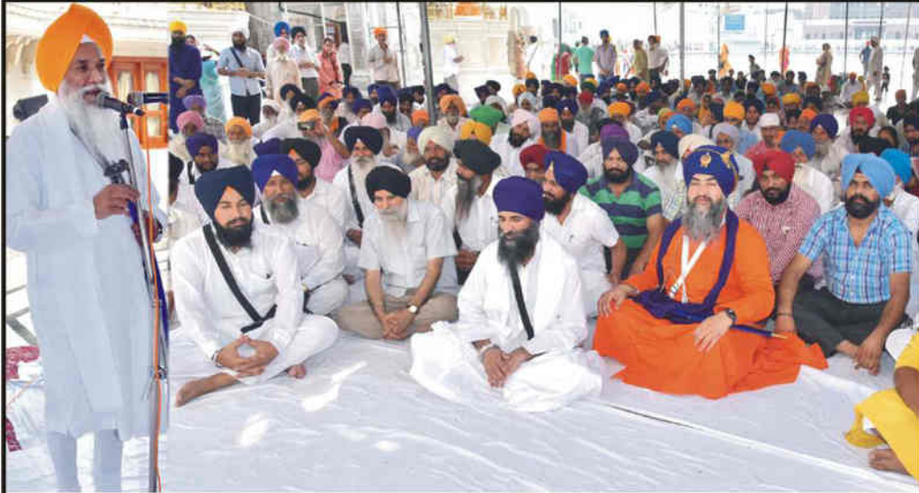
ਸ੍ਰੀ ਅਕਾਲ ਤਖ਼ਤ ਸਾਹਿਬ ਵਿਖੇ ਮੀਰੀ-ਪੀਰੀ ਦਿਵਸ ਮਨਾਉਣ ਸਮੇਂ ਸੰਗਤਾਂ ਨੂੰ ਸੰਬੋਧਨ ਕਰਦੇ ਹੋਏ ਸਿੰਘ ਸਾਹਿਬ ਗਿਆਨੀ ਗੁਰਬਚਨ ਸਿੰਘ ਜਥੇਦਾਰ ਸ੍ਰੀ ਅਕਾਲ ਤਖ਼ਤ ਸਾਹਿਬ।