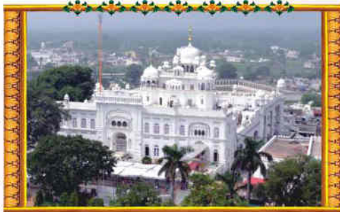
ਤਖ਼ਤ ਸ੍ਰੀ ਕੇਸਗੜ੍ਹ ਸਾਹਿਬ, ਸ੍ਰੀ ਅਨੰਦਪੁਰ ਸਾਹਿਬ (ਰੋਪੜ)

ਤਖ਼ਤ ਸ੍ਰੀ ਕੇਸਗੜ੍ਹ ਸਾਹਿਬ, ਸ੍ਰੀ ਅਨੰਦਪੁਰ ਸਾਹਿਬ (ਰੋਪੜ) (ਜਿਥੇ ਸ੍ਰੀ ਗੁਰੂ ਗੋਬਿੰਦ ਸਿੰਘ ਜੀ ਨੇ 1699 ਈ: ਨੂੰ ਵਿਸਾਖੀ ਵਾਲੇ ਦਿਨ ਖ਼ਾਲਸਾ ਪੰਥ ਦੀ ਸਾਜਨਾ ਕੀਤੀ) ਵਿਖੇ ੨੪ ਅੱਸੂ ਸੰਮਤ ਨਾਨਕਸ਼ਾਹੀ ੫੪੮ ਮੁਤਾਬਿਕ 09 ਅਕਤੂਬਰ 2016 ਦਿਨ ਐਤਵਾਰ ਸਵੇਰੇ 10:00 ਵਜੇ ਤੋਂ ਦੁਪਹਿਰ 3:00 ਤੀਕ ਹੇਠ ਲਿਖੇ ਅਨੁਸਾਰ ਗੁਰਮਤਿ ਸਮਾਗਮ ਹੋਵੇਗਾ।