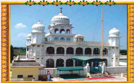
ਗੁਰਦੁਆਰਾ ਲੋਹਗੜ੍ਹ ਸਾਹਿਬ ਪਾ:10ਵੀਂ, ਪਿੰਡ ਦੀਨਾ, ਮੋਗਾ