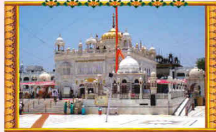
ਤਖ਼ਤ ਸੱਚਖੰਡ ਸ੍ਰੀ ਹਜ਼ੂਰ, ਅਬਚਲ ਨਗਰ ਸਾਹਿਬ, ਨਾਂਦੇੜ (ਮਹਾਰਾਸ਼ਟਰ)

ਤਖ਼ਤ ਸੱਚਖੰਡ ਸ੍ਰੀ ਹਜ਼ੂਰ, ਅਬਚਲ ਨਗਰ ਸਾਹਿਬ, ਨਾਂਦੇੜ, ਮਹਾਰਾਸ਼ਟਰ (ਜਿਥੇ ਸਾਹਿਬ ਸ੍ਰੀ ਗੁਰੂ ਗੋਬਿੰਦ ਸਿੰਘ ਜੀ ਸ੍ਰੀ ਗੁਰੂ ਗ੍ਰੰਥ ਸਾਹਿਬ ਨੂੰ ਗੁਰਤਾ-ਗੱਦੀ ਸੌਂਪ ਜੋਤੀ-ਜੋਤਿ ਸਮਾਏ) ਵਿਖੇ ੧੭ ਕੱਤਕ ਸੰਮਤ ਨਾਨਕਸ਼ਾਹੀ ੫੪੮ ਮੁਤਾਬਿਕ 01 ਨਵੰਬਰ 2016 ਦਿਨ ਮੰਗਲਵਾਰ ਰਾਤ 8:00 ਵਜੇ ਤੋਂ 12:00 ਵਜੇ ਤੀਕ ਹੇਠ ਲਿਖੇ ਅਨੁਸਾਰ ਗੁਰਮਤਿ ਸਮਾਗਮ ਹੋਵੇਗਾ।